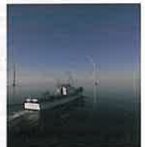
HAVVINDMØLLER: Fisken trives i Lillgrund havvindpark i Sverige.

Prøvefiske viser at havvindparken Lillgrund (omtalt i TU nr. 32/09) lokker til seg fisk og ikke forstyrrer den. De 48 turbinene fra Vattenfall står på betongfundamenter, og mellom disse er det nå mer bunnfisk enn tidligere. Det er blitt litt mer torsk, og tydelig flere ål og ulke. Dette kan skyldes at det er trygt mellom fundamentene, og det fins mat der, sier en representant fra Fiskeriverket til Sveriges Radio. Det skal nå forskes mer på dette. KMH